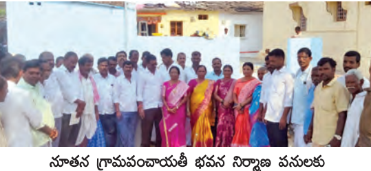
నూతన గ్రామపంచాయతీ భవన నిర్మాణ వనలకు భూమిపూజ చేస్తున్న నాయకులు